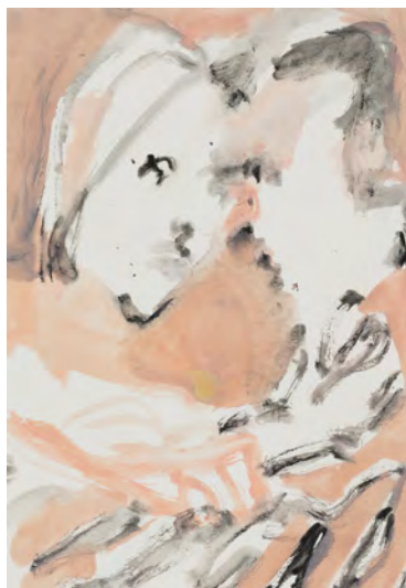
左：“20220820”，2022, oil on canvas, 480 × 390 mm