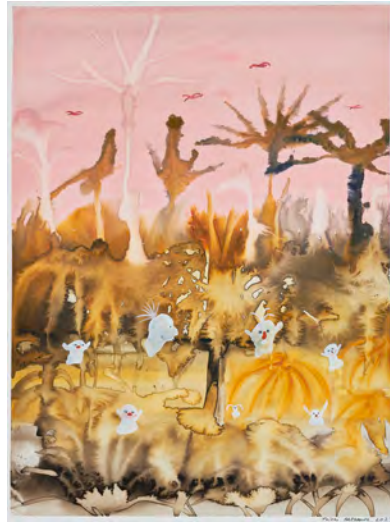
右 : "The Meeting Starts in the Grass", 2023, watercolor on paper, 550 × 415 mm