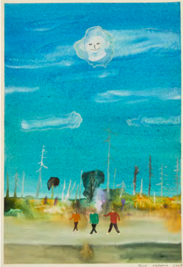
左 : "Dream of the Young", 2024, watercolor on paper, 394 × 273 mm