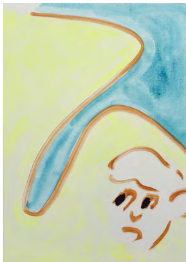
右 : "untitled", 2022, acrylic on paper, 353 × 252 mm