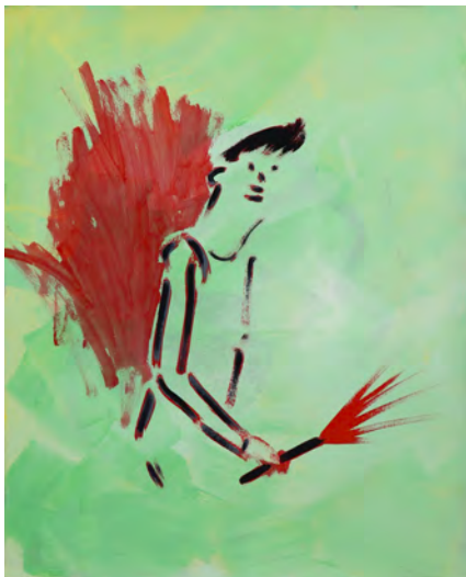
左 : "untitled", 2014, acrylic on paper, 454 × 379 mm

1982年神奈川県生まれ、2008年に東京造形大学・美術学部・絵画専攻領域を卒業。キャンパスに油彩、あるいは紙に水彩で描く具象作品、雑誌の切り抜きの上にアクリル絵具などで自由にストロークを加えたミクストメディアの作品など様々な制作を行なうアーティストです。いずれの作品でもシンボルやメタファーが用いられ、一貫して、自然の摂理を逸脱することで進歩してきた人間に対する複雑な思いをメッセージに込めています。本展では生き生きとしたブラッシュストロークや滲みが特徴的な、紙を支持体とする水彩画7点を展示します。近年の展覧会として、2024年個展『WHERE ARE WE?』（YIRI ARTS／台北、台湾）、『ROADS NOT ON THE MAP』（CAVE-AYUMI GALLERY／東京）、グループ展『Lost in Paintings』（Heimlichkeit Nikai／東京）、2023年グループ展『New Origins - Level Unlocked』（Andrea Festa Fine Art／ローマ、イタリア）、2022年グループ展『Men Who Paint Flowers』（Mindy Solomon Gallery／マイアミ、アメリカ）、2021年個展『中村太一展』（Galleria Finarte／名古屋）などが挙げられます。